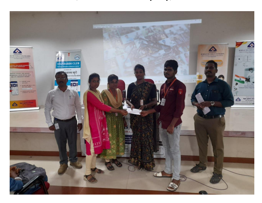
II – Prize: Rs. 750/- (Seven hundred and fifty only)